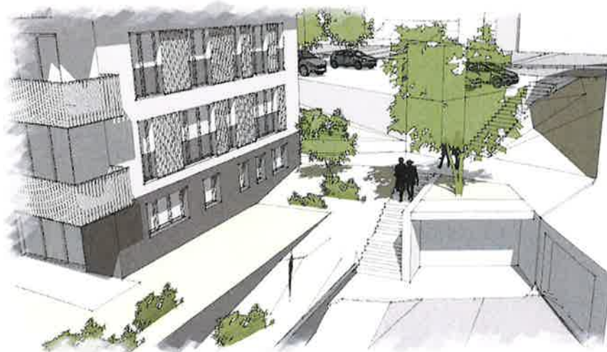
Projection depuis l'administration communale

Le projet remplace donc les 6 places de parc existantes par 9 places pour les véhicules légers et une place handicapé, une zone pour les deux roues, un ascenseur et un nouvel escalier reliant les différents niveaux ainsi qu'une galerie débouchant sur l'actuel parking sis devant l'administration communal.