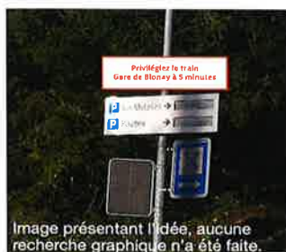
Image présentant l'idée, aucune recherche graphique n'a été faite.