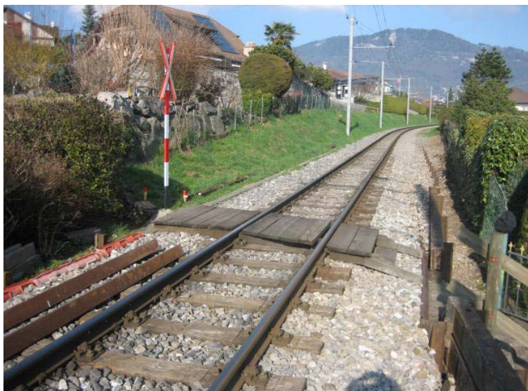
La Tour Ronde