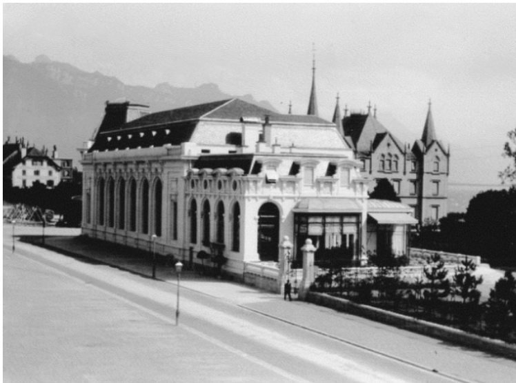
Vue générale du Casino du Rivage, avant les premières transformations des années '40

En 1988, la commune a décidé de l'achat du Château de l'Aile à la famille Couvreur, propriétaire pendant plus de trois siècles. Un concours d'architecture a été lancé en 1991 en vue de réaliser un centre récréatif, culturel et hôtelier, projet qui a échoué étant donné la conjoncture économique défavorable de ces années-là. Cette situation a abouti à la décision de vendre la propriété du Château de l'Aile. C'est en 2007, dans le cadre des décisions liées à l'avenir du Château de l'Aile, que le Conseil communal de Vevey accordait à la municipalité un crédit pour financer l'étude de la rénovation de la Salle del Castillo. Cette même année, la Municipalité et le Conseil communal ont accepté l'offre d'achat de M. Bernd Grohe pour le Château de l'Aile, et la promesse de vente et d'achat de Projet109 SA pour la parcelle sur laquelle est situé l'actuel restaurant du Rivage.