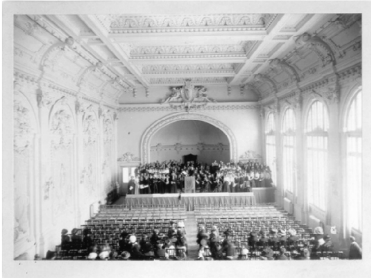
Vue de la salle avec la scène d'origine, qui sera ensuite entièrement transformée en 1955-1956

Entre sa construction et les années 1980, le bâtiment a été transformé à plusieurs reprises, jusqu'à ce que la municipalité de l'époque en vienne à appréhender de manière globale l'avenir du périmètre Casino du Rivage et Château de l'Aile.