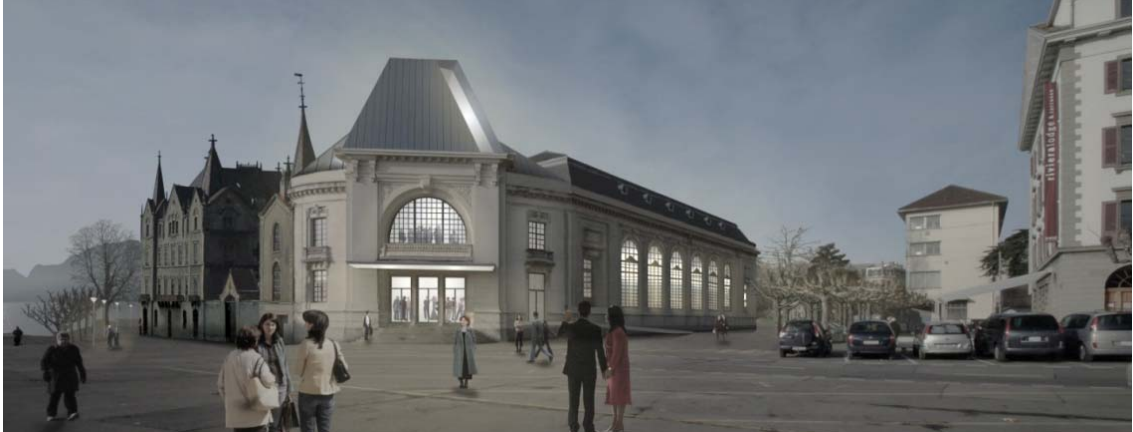
Image informatique de la salle depuis la Place du Marché (extrait de la planche du concours du projet « gilles & jacques »)